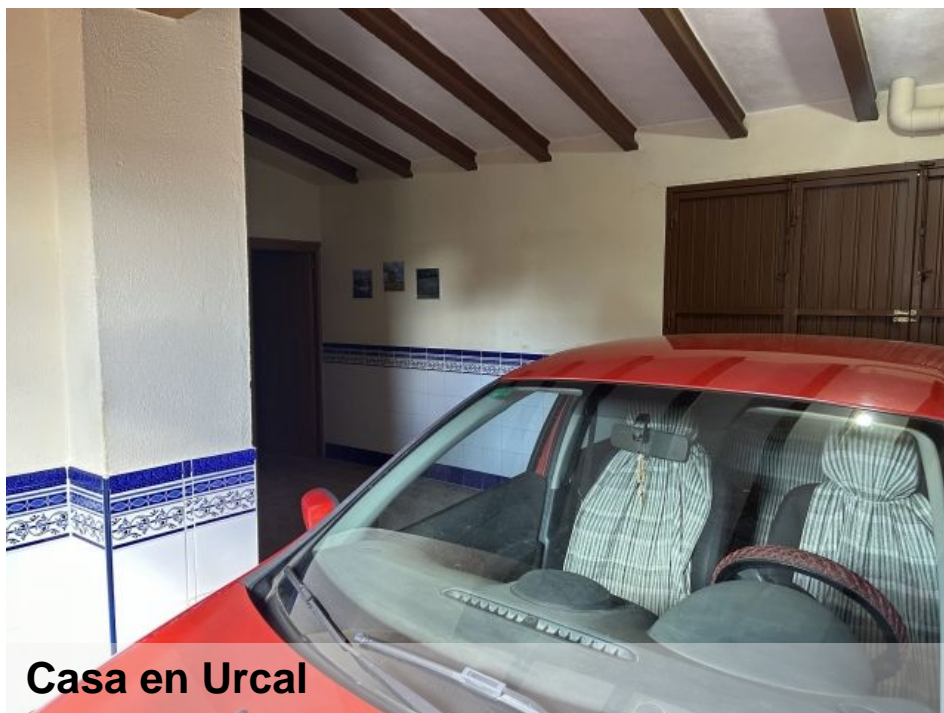
Casa en Urcal